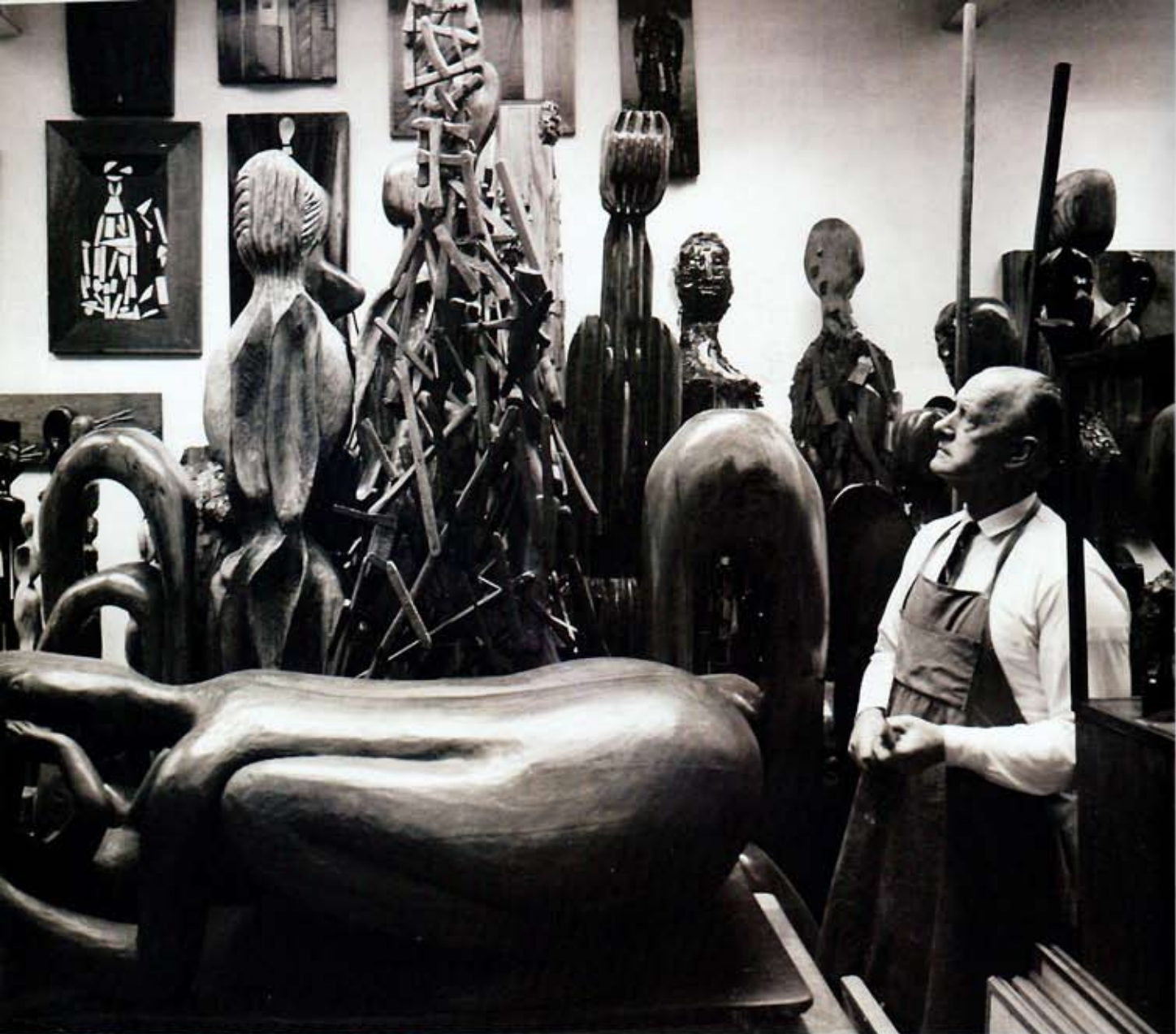
ARCHIVO AURORA SJÖLANDER / K.W. GILLER

paso del tranvía que iba a Tacubaya. Para aquella época, el matrimonio era un escándalo, ¿podría ser tu padre! decía mi mamá. Y la familia no lo conocía. Pero a mí me gustaba mucho, era un hombre guapísimo, y creí en él. A los dos meses me casé y me quedé junto a él a pesar de los momentos difíciles.