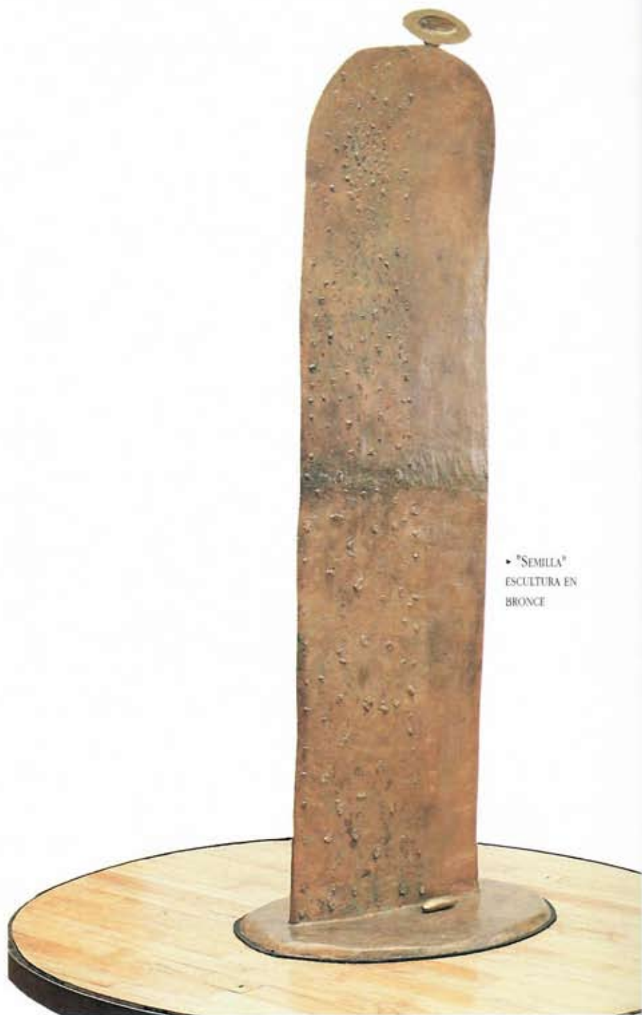
► "SEMILLA" ESCUPTURA EN BRONCE

En el espacioso estudio, Aurora lo conserva todo como lo dejó su esposo. Es una especie de cueva de Alí Babá del arte: hay más de 40 lienzos, uno enorme, casi un mural, con rectángulos verticales como torres fantásticas sobre cielo