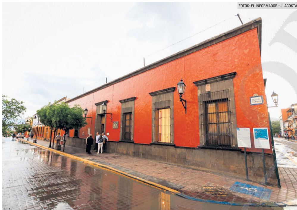
MUNAT. Fachada del recinto cultural que reabre sus puertas. El edificio data del siglo XIX.

“Yo creo que los tiempos van bastante ágiles para los trámites que normalmente se tienen que hacer en gobierno. Es un edificio patrimonial, es muy importante y tenemos que tener todos los cuidados”, indicó.