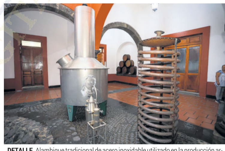
DETALLE. Alambique tradicional de acero inoxidable utilizado en la producción artesanal de tequila.