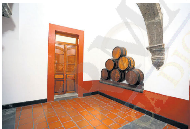
ESTAMPAS. En la imagen se observan barricas de madera apiladas en un nicho.