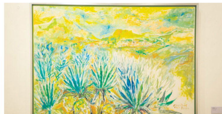
INTENCIÓN. La muestra propone una mirada sobre el disfrute, la convivencia y la contemplación.