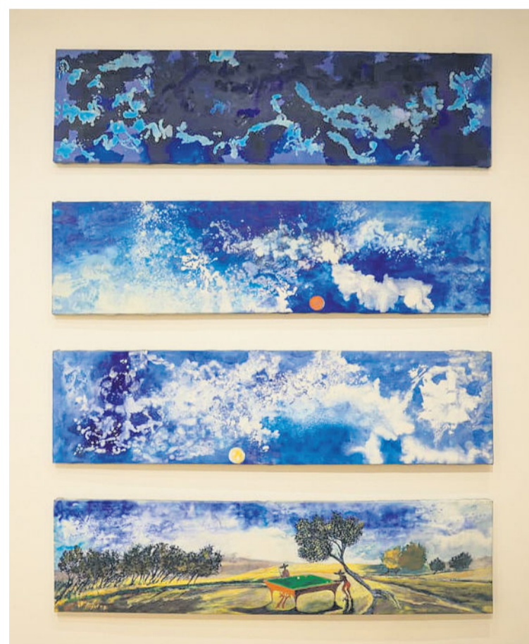
ORIGEN. La exposición de reapertura está inspirada en un verso de Ramón López Velarde.