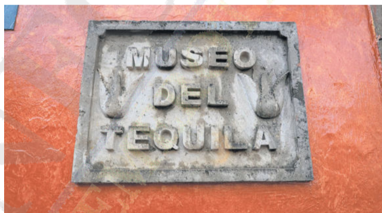
IDENTIDAD. Placa de piedra tallada que identifica al Museo Nacional del Tequila.