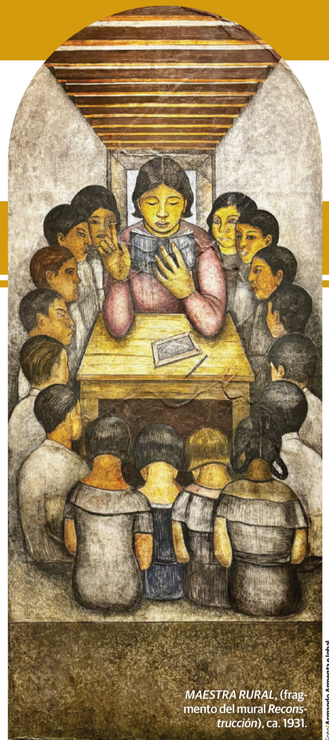
MAESTRA RURAL , (fragmento del mural Reconstrucción ), ca. 1931.

4 SIN TÍTULO ( Ciencia y Tecnología ), óleo sobre madera, s/f.