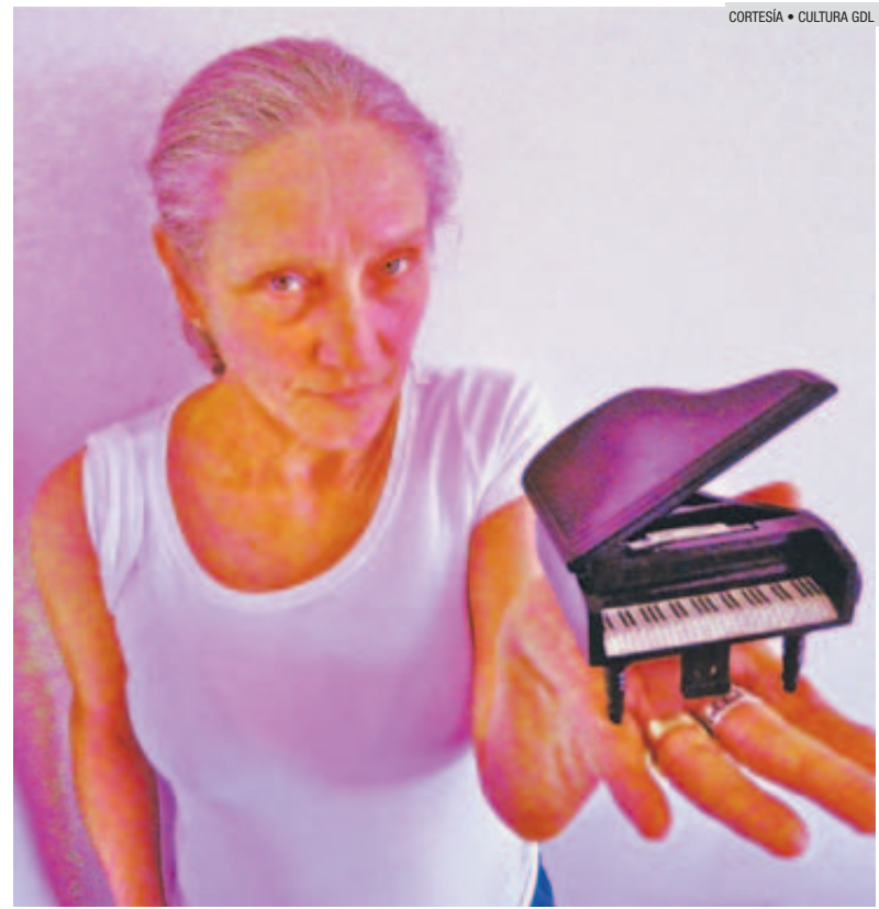
LILIANA FELIPE. La artista estará en el Foro Larva.