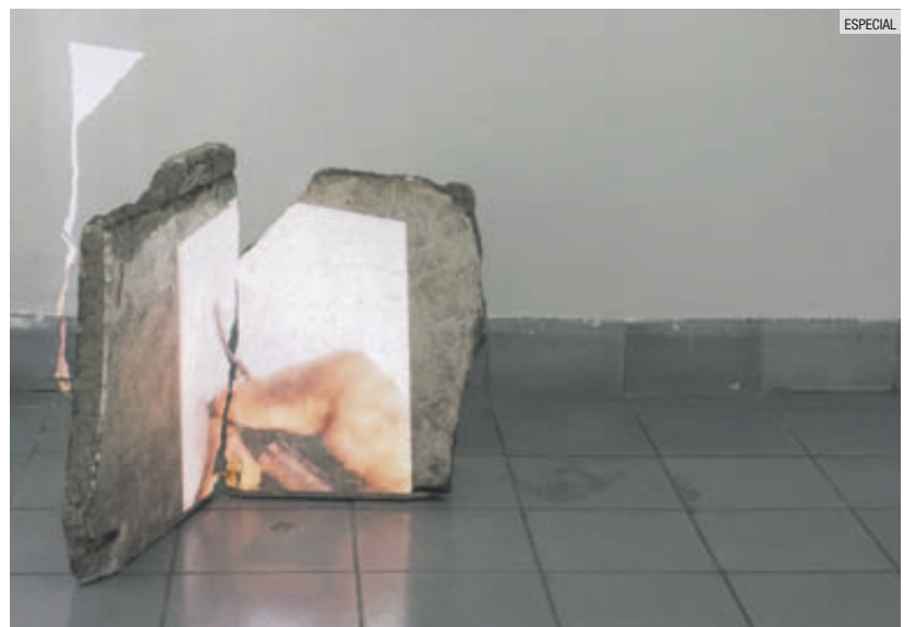
XEL-HA LÓPEZ. Está en la muestra "Todas las fuerzas" del proyecto curatorial Atalanta de Alejandra Ruiz; el mensaje del proyecto es la resistencia.