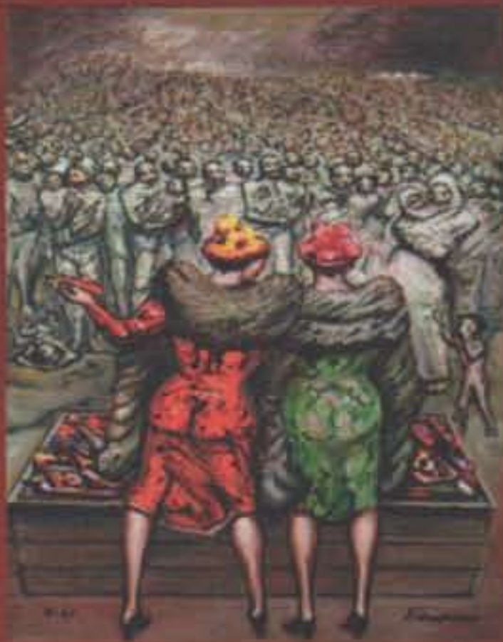
DAVID ALFARO SIQUEIROS Entrega de juguetes