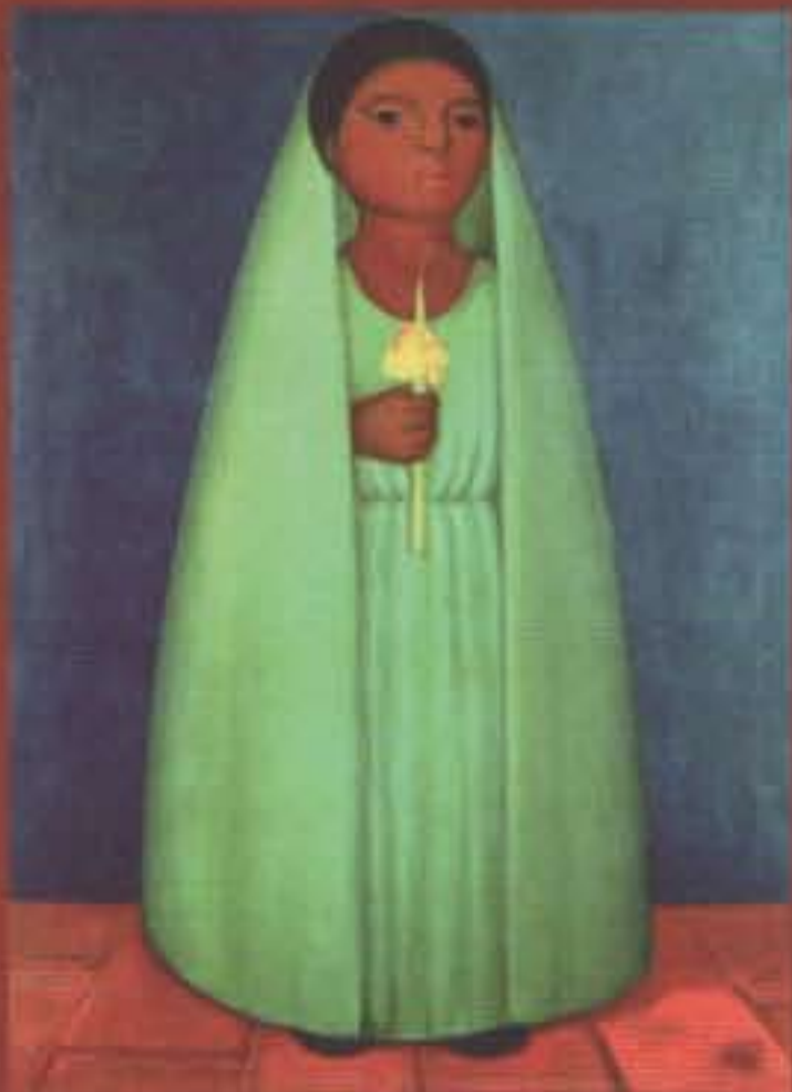
CARLOS OROZCO ROMERO Niña con vela y manto azul