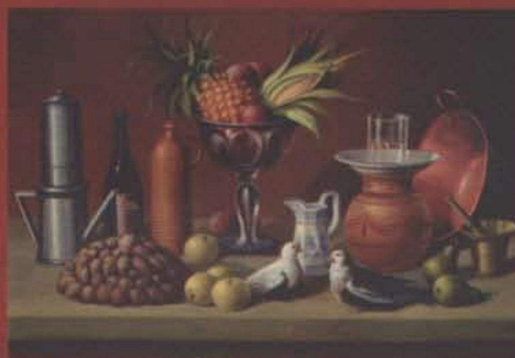
AGUSTIN ARRIETA Bodegón mexicano con palomas