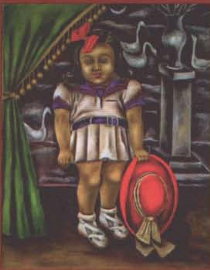
MARÍA IZQUIERDO Niña con sombrero rojo

"A través de estas etapas muy marcadas quiere mostrar cuál es su aporte, no fue una artista que se ciñó a modas, que por querer vender hiciera lo que la gente quería. Ella siguió su propio camino y en ese sentido fue vanguardista en cuanto a colores, composiciones y en algunos casos en cuanto a temáticas."