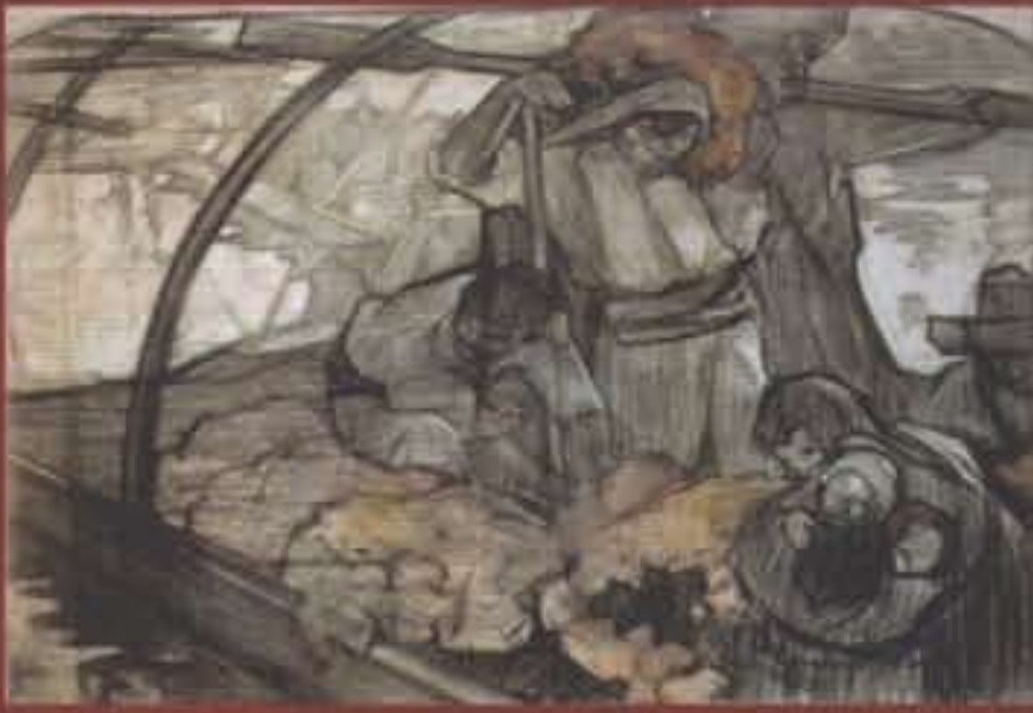
SATURNINO HERRÁN La ofrenda

"...Su grandeza estriba no sólo en la perfección de su oficio, en su variado colorido, en el contenido costumbrista mexicano de su pintura, sino también en el interés y compromiso social que adquiere: su atención se detiene ante el trabajador, frente al pordiosero, ante aquellos que nadie, antes que él, se atrevió a trazar."