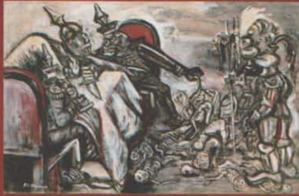
JOSÉ CLEMENTE OROZCO Criminales de guerra