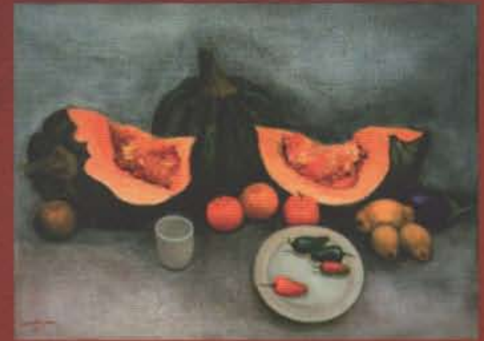
LUIS NISHIZAWA Naturaleza muerta (calabazas y chiles)

Diego Rivera, artista plástico y esposo de la pintora