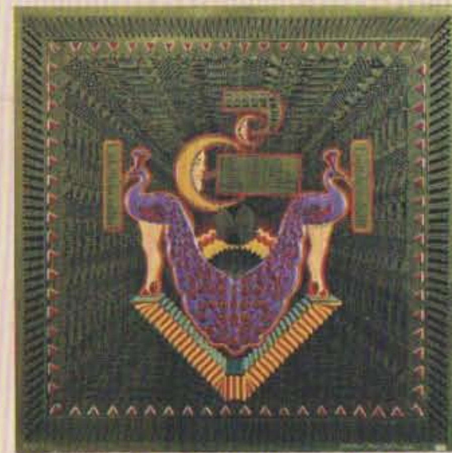
Pedro Friedeberg "Lámina de Pavos" Siglo XX (1982) Serigrafía sobre papel