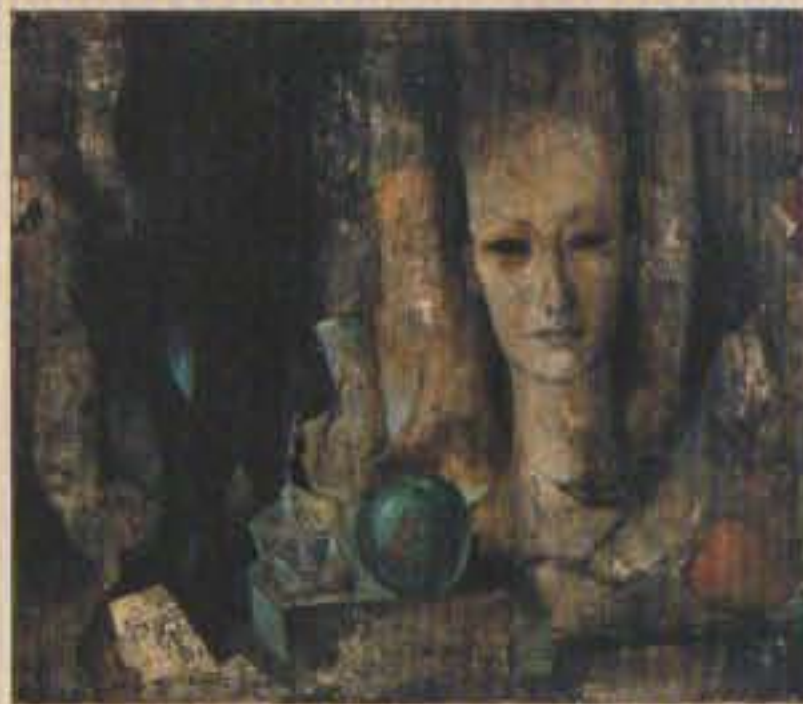
Roberto Montenegro "La manzana verde" Siglo XX (1964) Óleo sobre masonite

Los artistas aquí expuestos lideraron los cambios más sobresalientes hacia una nueva identidad del arte mexicano y la gran mayoría estuvieron ligados a la Galería de Arte Mexicano; en este núcleo encontramos a: Roberto Montenegro, Carlos Mérida, David Alfaro Siqueiros, Rufino Tamayo, Leonora Carrington, Carlos Orozco Romero y Jesús "Chucho" Reyes Ferreira.