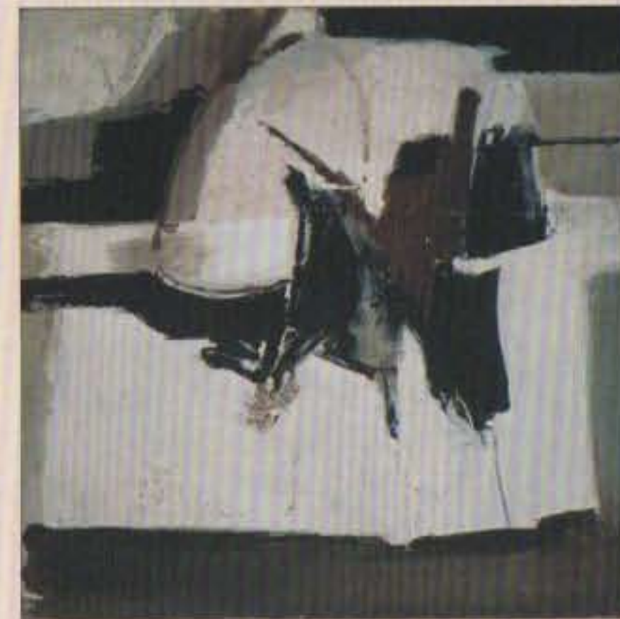
Fernando García Ponce "Espacio mayor" Siglo XX (1966) Óleo sobre tela