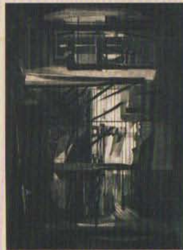
Francisco Moreno Capdevilla "Luz y tinieblas" Siglo XX (1970) Grabado sobre papel

Artistas como Gunther Gerzso, Waldemar Sjolander, Cordelia Urueta, Pedro y Rafael Coronel, Francisco Moreno Capdevilla y Chucho Reyes marcaron de manera suave pero definitiva, la culminación del incesante "pionerismo" que caracteriza la eterna transición y entrada de México a la modernidad.