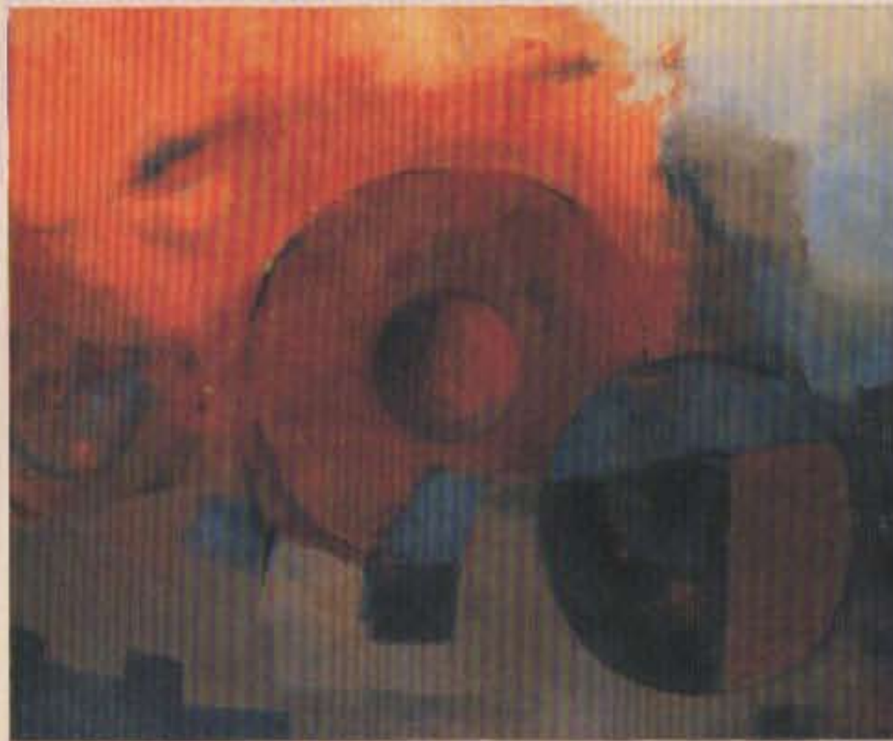
Cordelia Urueta "Combustión" Siglo XX (1978) Óleo sobre tela

Período en el que se vislumbra claramente el porvenir de la abstracción en México.