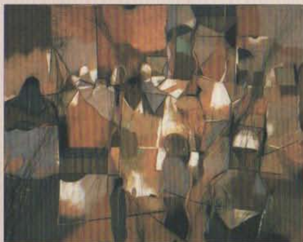
Gabriel Macotela "Sin título" Siglo XX (1984) Mixta sobre tela

En este módulo destacan los "grupos" que serían el siguiente fenómeno de organización artística emanada principalmente de la Escuela Nacional de Artes Plásticas de la UNAM.