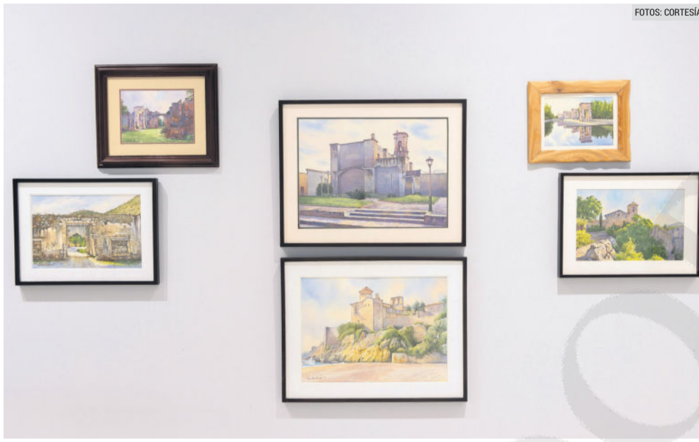
COLECCIÓN. Más de 100 obras conforman la muestra "Artífice de la luz".

"Conocí muchas personas jóvenes que afortunadamente vi que se dedican a esta profesión. Entonces, eso para mí es un motivo de satisfacción, darme cuenta de que hice mi trabajo".