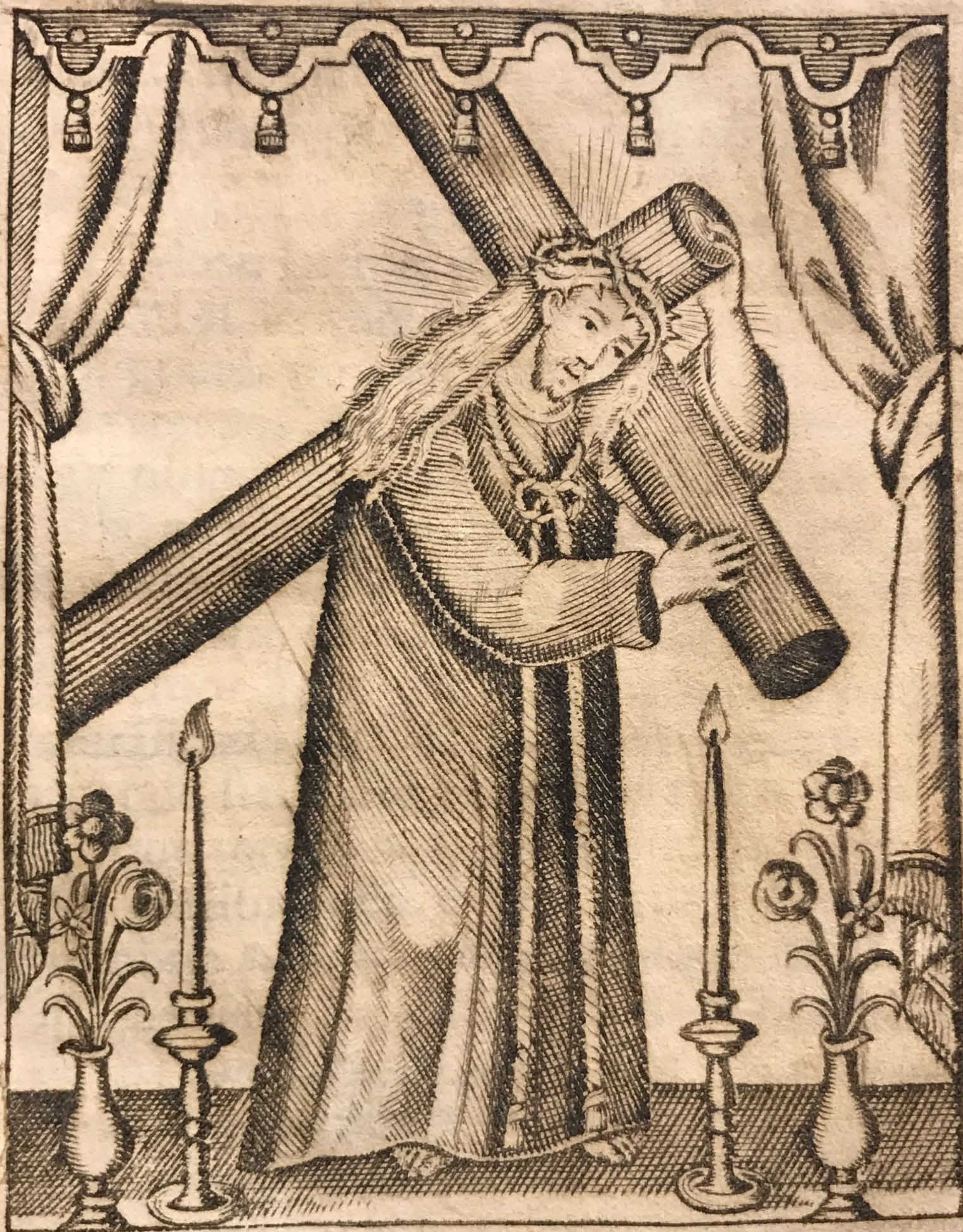
Copia de la Milagr. Imagen de JESUS que se venera en su Santuario del Pueblo de Teocoaltitich del Reyno de la Nueva Galicia. Joseph Benito Ortuno del. Sep.