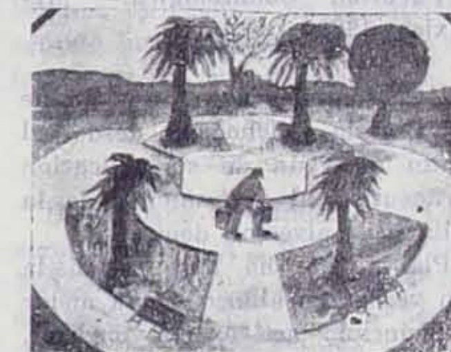
Pintura de Niños de Jalisco.

ley, y aun vive bajo su influencia a pesar de sus preferencias por los asuntos típicos mexicanos. Es famoso y tiene una amplísima labor. Ponce de Leon fué uno de los que trajeron la buena nueva de la Revolución Artística en Barbiscen. Aún no rompía Cézanne con ella. Toda la juventud francesa era atraída. Pero mas que pintor, fué Ponce de Leon caricaturista. Hay en nuestro Museo muchos de sus cartones, y su magistral auto-caricatura. Atl fué el que hizo estallar la mina con su espíritu explosivo. Con su conducta excéntrica. Con su radiante verbosidad sosteniendo su más radizante impresionismo lleno de fulgurantes colores cundió el escandalo. Vino el retraimiento, la alarma. Jorge Enciso prefirió los estudios de las artes decorativas, con un sentido leal y fuerte, algo como un preludio de los grandes ensayos actuales. Puvis de Chavannes lo subyugó. Sirvió con cariño la causa nacional y ennoblecó las figuras de hombres y mujeres de nuestras bajas clases. Ixca Farias, fué y sigue siendo paisajista. Con gran sentimiento. Impresionista moderado. Los caricaturistas dieron la señal de partida de los nuevos tiempos: Sthal, Romo, Zuno, Vene-