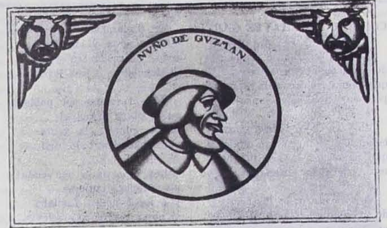
AMADO DE LA CUEVA. Decoración del Palacio de Gobierno de Guadalajara.