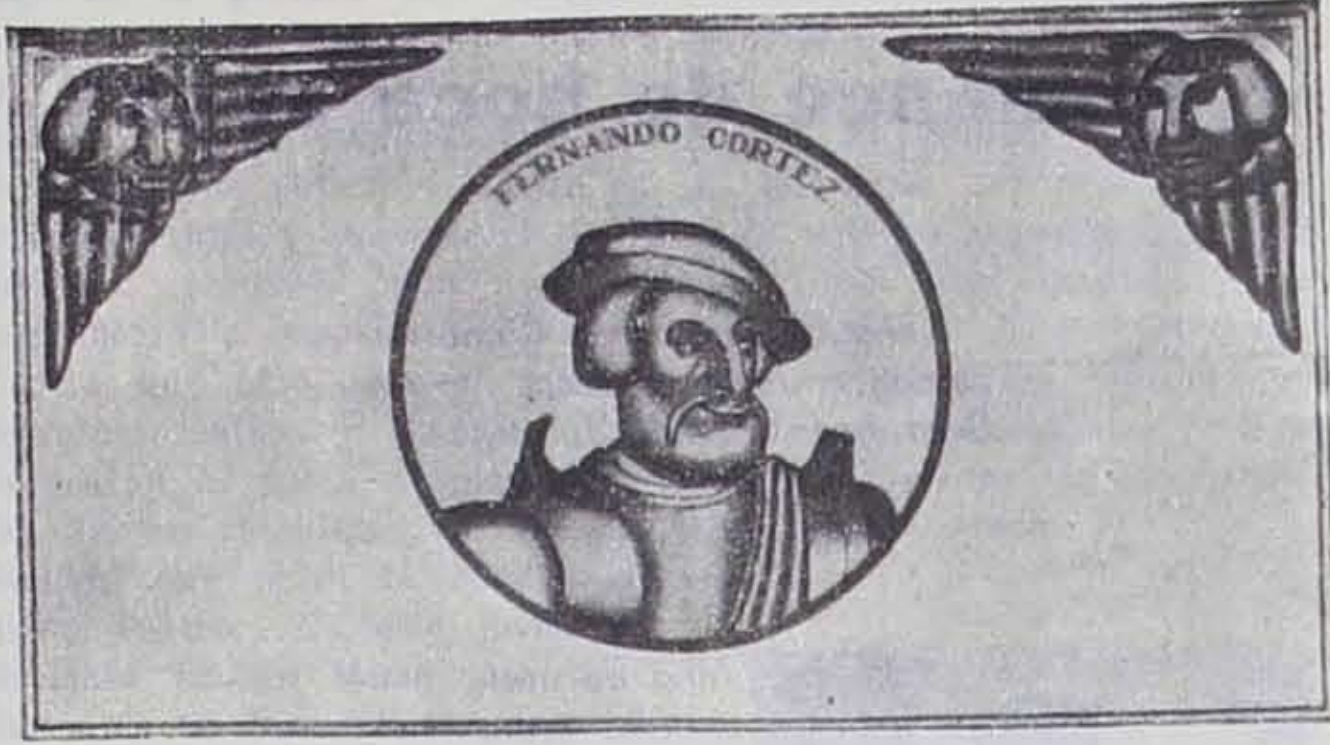
AMADO DE LA CUEVA. Decoración del Palacio de Gobierno de Guadalajara.