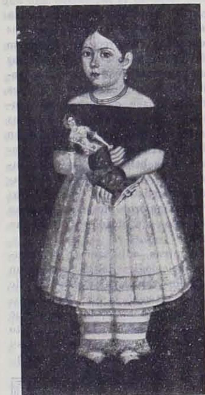
RETRATO DE NIÑA Pintura Antigua Mejicana

Pero la verdadera pintura mexicana de estos tiempos, no está aún en los museos; se encuentra abandonada, desconocida aún, diseminada en los templos de los