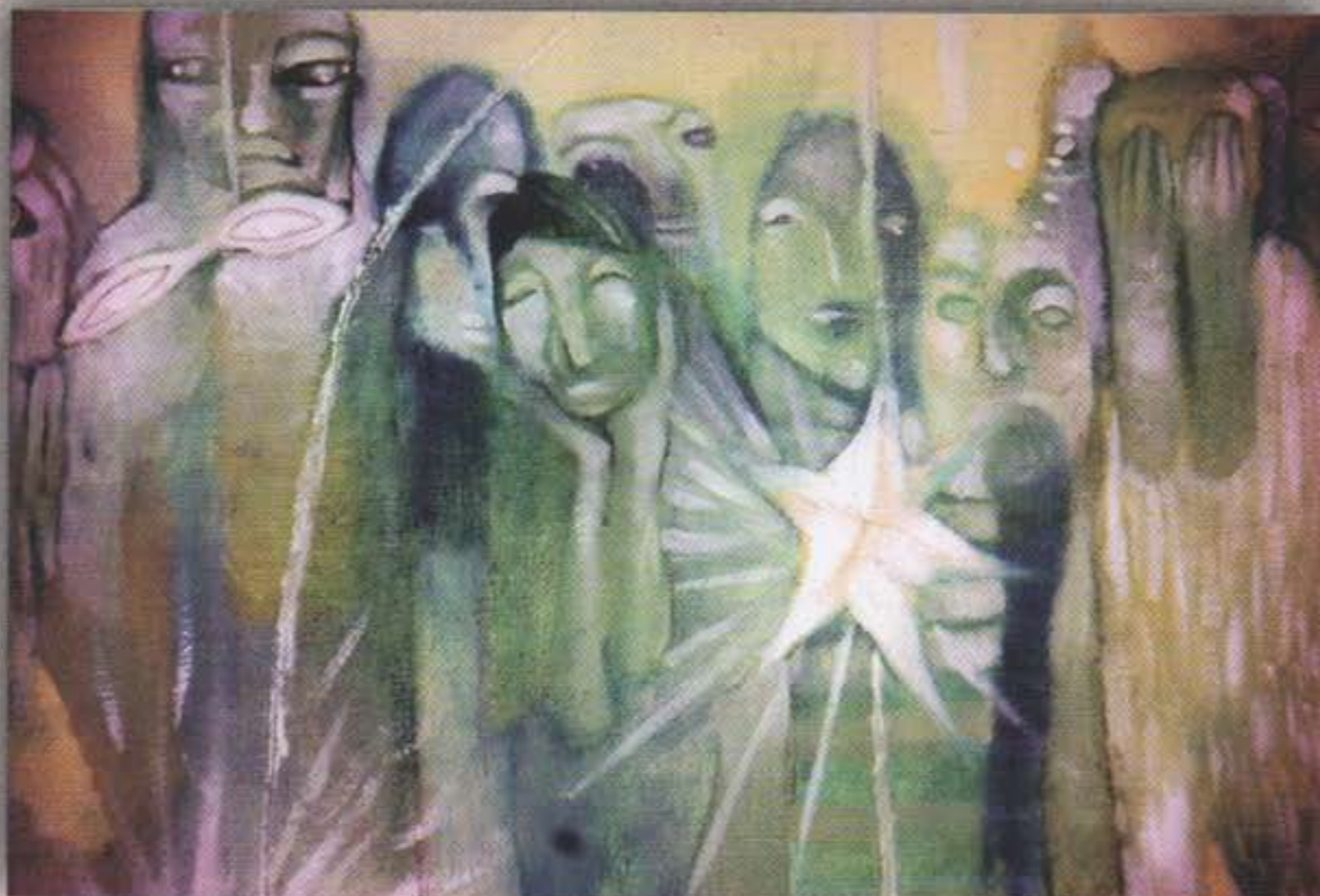
Asombro (detalle) • tela • 80 x 120 cms. • 2011

Ha participado en innumerables exposiciones colectivas.