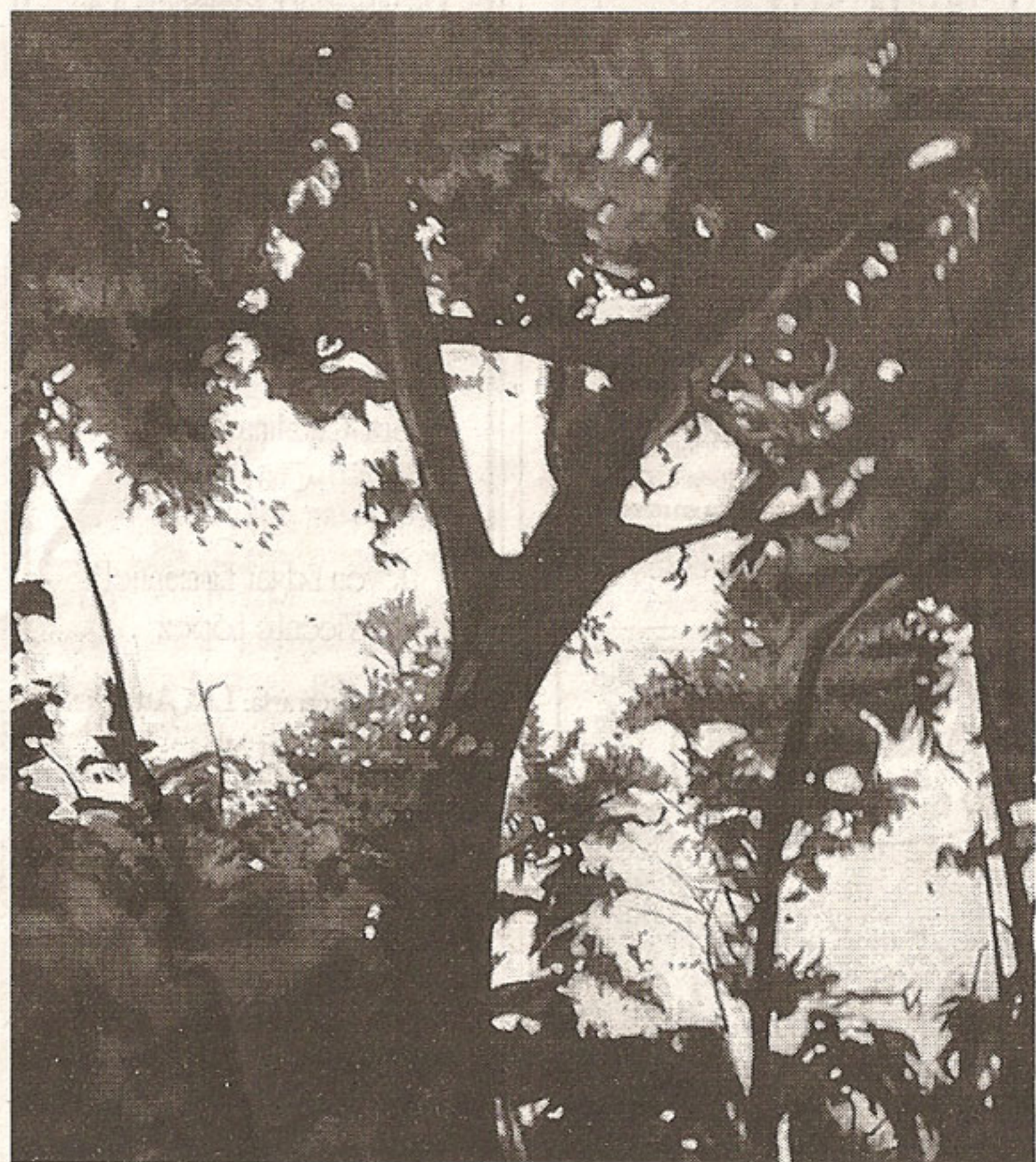
Detalle de uno de los cuadros que integran la exposición

En búsqueda del Paraíso se mostrará desde hoy, a las 20:30 horas, en galería Pablo Guerrero (Pablo Neruda 2273, esquina Filadelfia). Y, para ir de acuerdo a la temática, quienes visiten la expo recibirán un arbolito para que lo siembren y recuperar, de alguna manera, algunos de los árboles caídos. ■ P