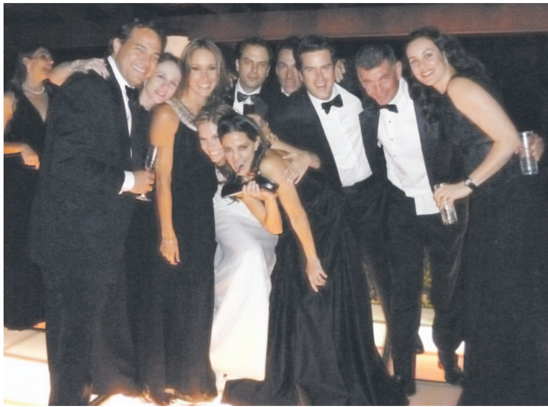
• Los amigos de los novios.