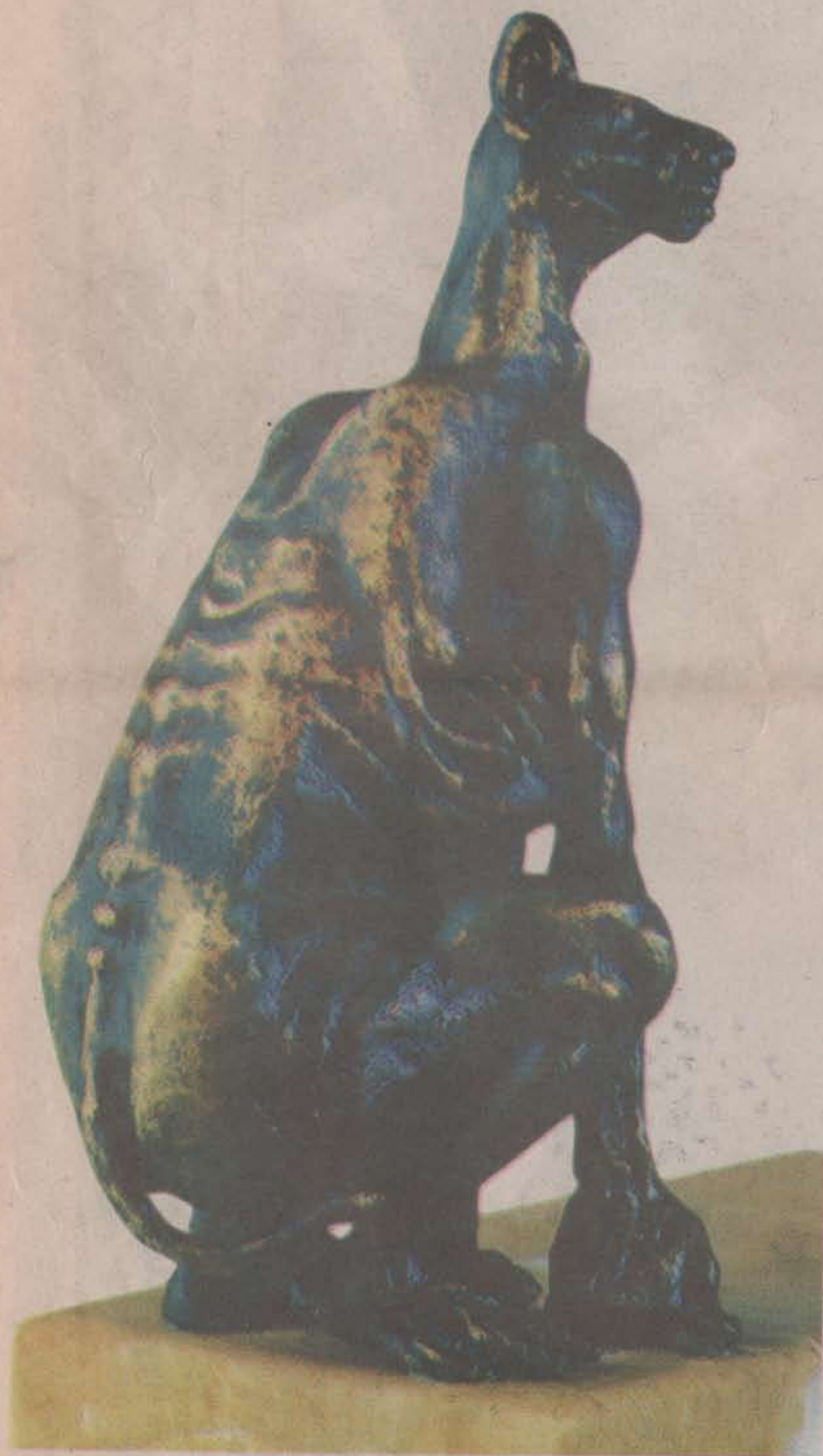
Guardián • Bronce a la cera perdida • 19 X 9 X 9 cm.