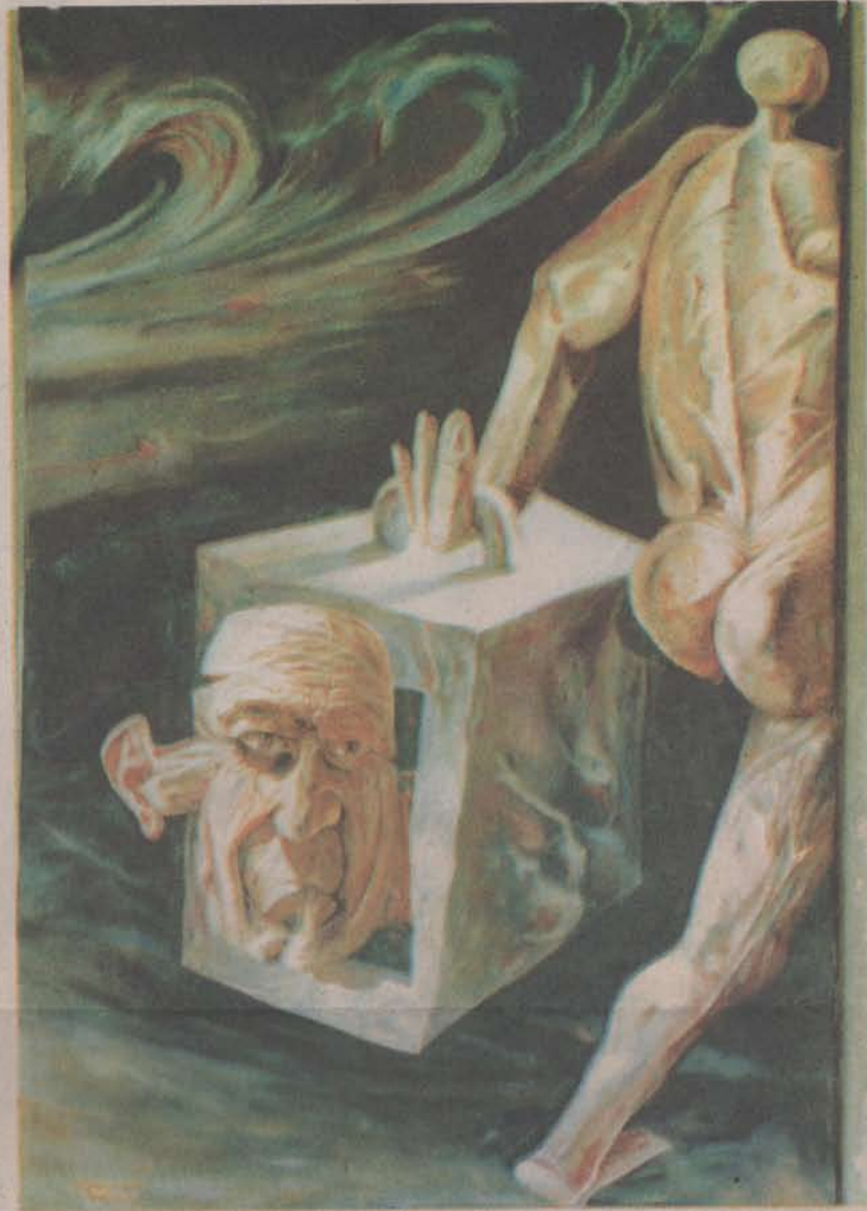
De viaje a Puente Grande • Óleo/tela