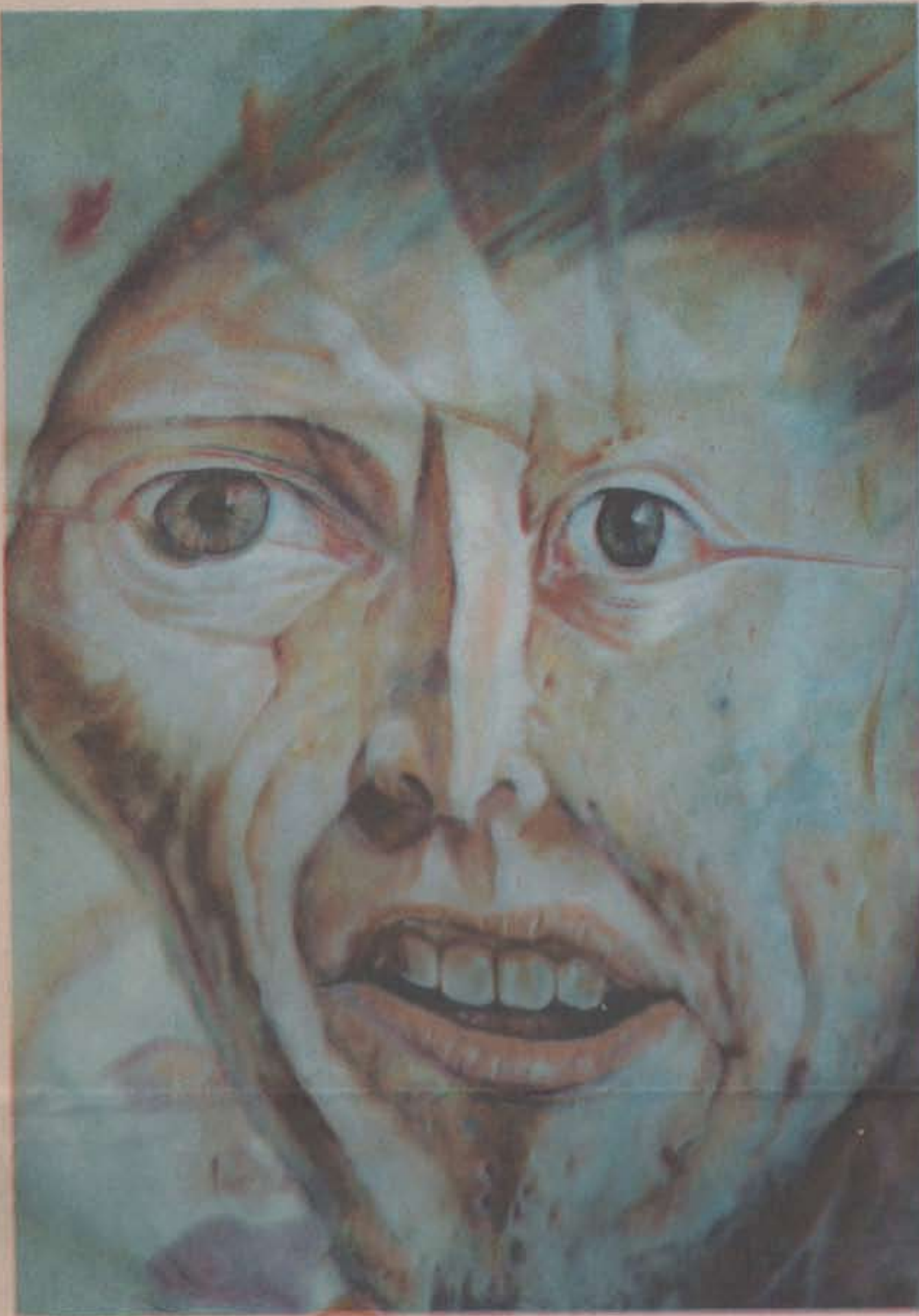
Detalle del detallito • Óleo/tela • 210 X 80 cm.