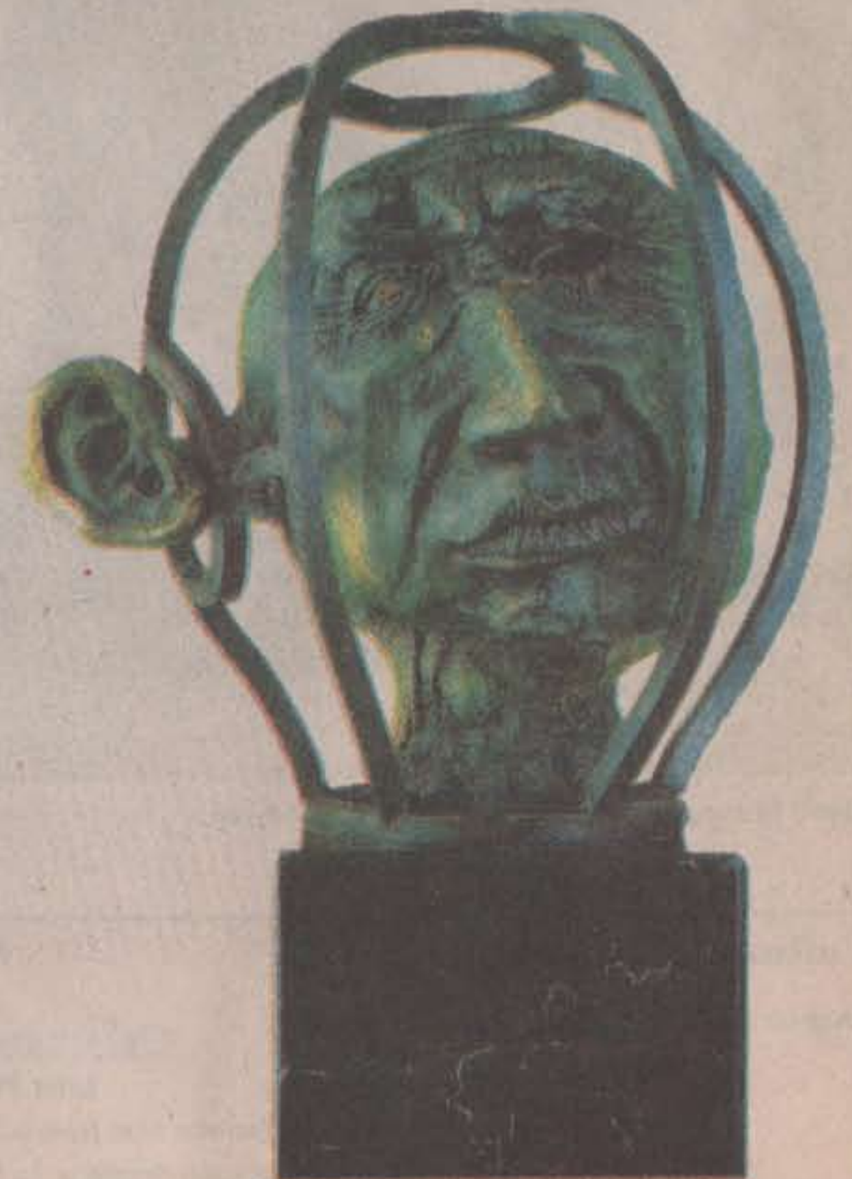
El oreja • Bronce a la cera perdida • 38 X 38 X 33 cm.