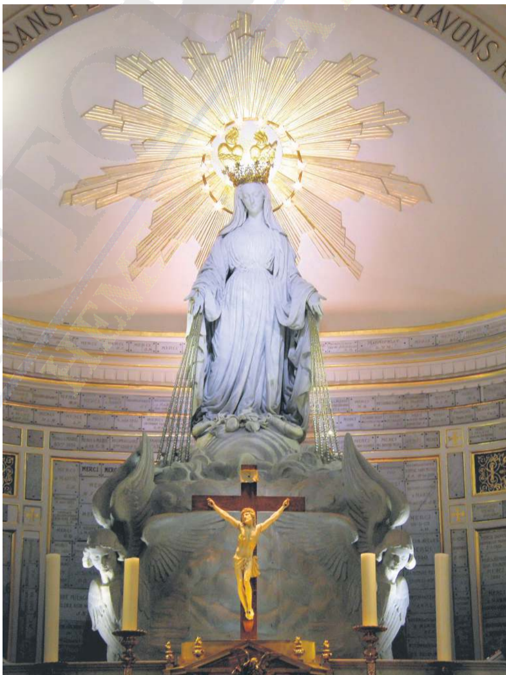
MILAGRO. ¡Sin duda que los milagros existen! El altar de Nuestra Señora de París resultó intacto después del tremendo incendio que la semana pasada se desató sobre la célebre Catedral de Notre Dame en París, uno de los templos católicos más importantes y visitados del mundo.

riodista sino como AMIGO de las organizadoras. Resulta tan importante la presencia GUADALUPANA en el "mundo mundial" pues es sinónimo de MÉXICO. Los más elegantes apellidos en ESPAÑA poseen en sus casas y palacios al menos una Virgen de GUADALUPE... Como en la Quinta de los TERRY en el PUERTO DE STA. MARÍA... Más que tirar el dinero en tratar de que las ciudades se conviertan en una marca comercial funciona mejor este otro modo de "promoción". Y bueno, ya siendo un hecho consumado el que los altares de NUESTRA SEÑORA DE PARÍS (cuya medalla se nos extravió y es milagrosísima) y el altar de SANTA MARÍA DE GUADALUPE milagrosamente o no están literalmente INTACTOS no nos queda más que volver a leer a VÍCTOR HUGO con su obra escrita en 1831 y recordar aquel viejo dicho sobre París: "Fluutat normegitur"... o lo que es lo mismo: "París puede ser batida por las olas... ¡pero jamás hundida!" y por hoy ¡COORTE!