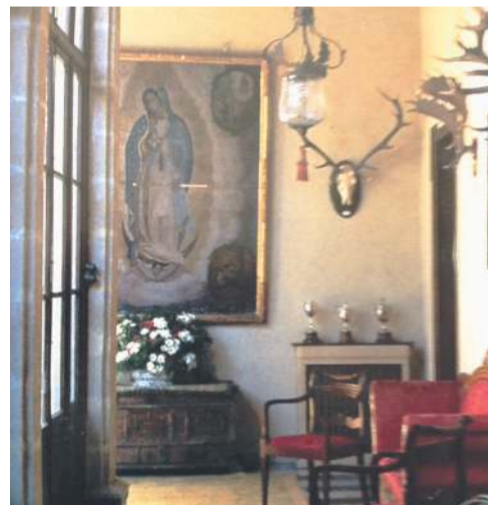
RAÍCES. Aunque por cuestiones naturales somos totalmente zapapanos, no negamos nuestra fe Guadalupana y por increíble que parezca, nos hemos topado con bellas imágenes de La Virgen de Guadalupe en los sitios más insólitos e inesperados como en este bello corredor/terrace en la elegante Quinta de los Terry en el Puerto de Santa María al lado de Jerez en plena Andalucía, enclave de las mejores familias de España y muchas emparentadas con tapatíos o con mexicanos.