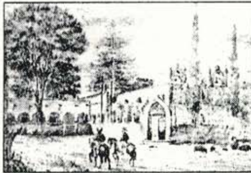
Vista de la Hacienda de Cedros (próxima a la ciudad de Guadalajara) por Celayeta; en ella paró a comer el Benemérito Don Miguel Hidalgo y Costilla en su camino de La Barca a Guadalajara (1810); siendo el lugar donde ocurrió reunión de la rica colección de retratos familiares de la línea del mayorazgo de Huejotlán.