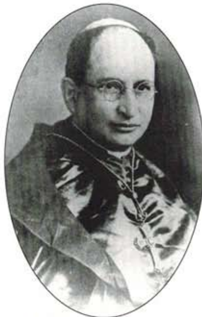
Ertmo. Dr. Dn. José Garibi y Rivera, primer cardenal mexicano.