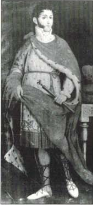
Dn. Agustín de Iturbide, consumador de la Independencia Nacional, y Emperador de México; por Dn. José Ma. Uriarte, Catedral de Guadalajara.