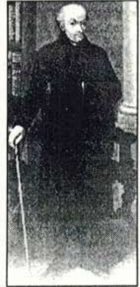
Don Miguel Hidalgo y Costilla, Iníciador de la Independencia Nacional y Padre de la Patria, por Don Antonio Barrero, 1831, M.N.H.