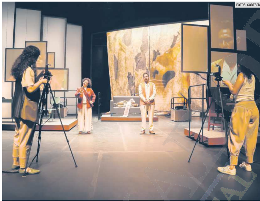
MONTAJE. La ceremonia de inauguración contará con la puesta en escena “Aleteo”.