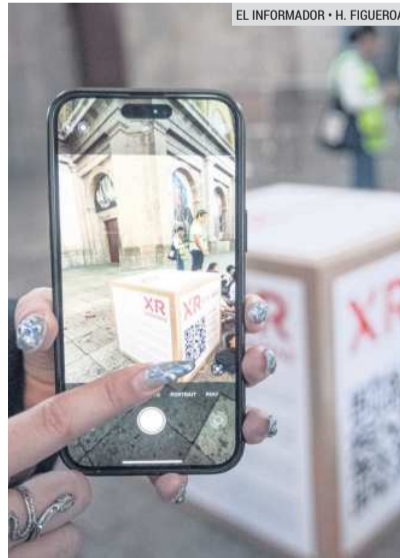
TECNOLOGÍA. Para disfrutar de la experiencia se debe escanear un QR.

Según las estimaciones del museo y los creadores de este proyecto digital, el efecto CABANAS XR, que alcanzó 10 mil vistas durante su jornada inaugural, logrará 2.5 millones de vis-