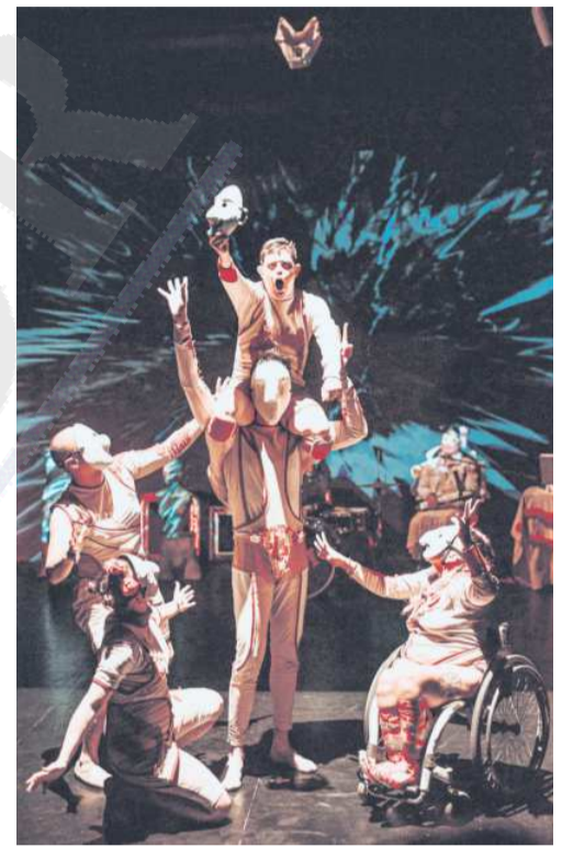
TEATRO. Escena de la obra “Raro”.