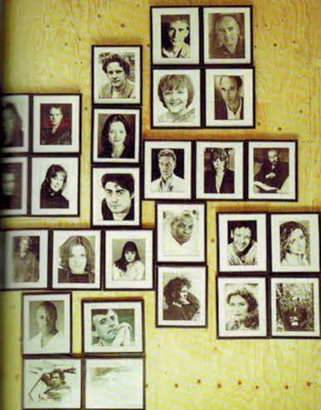
Shows an Performance D & Practice st 2011-8