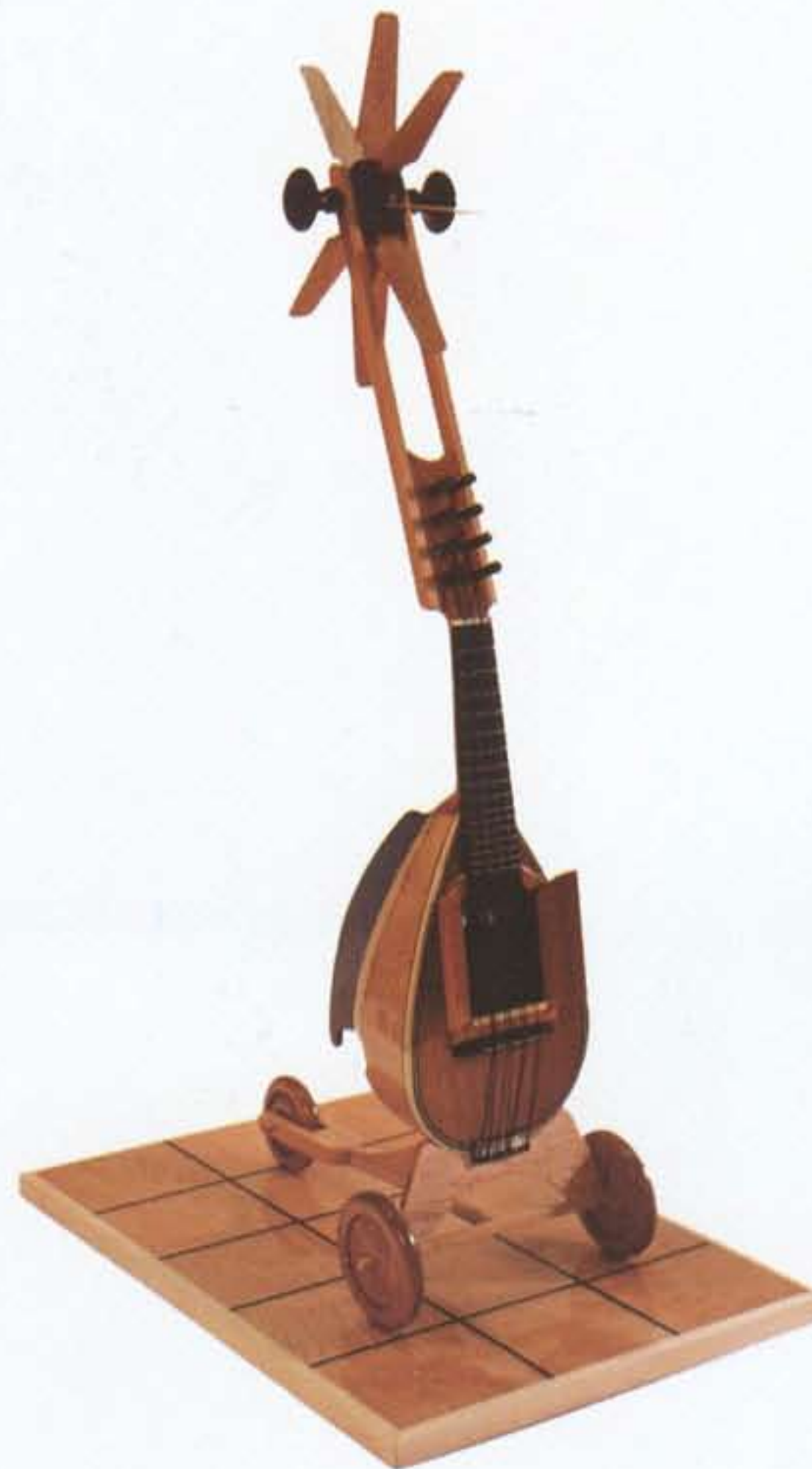
"Mandolina" Escultura y arte objeto en madera 53.5x22x14 cm. 2009

Camerata, Museo Macay, A.C., Mérida, Yucatán, México.