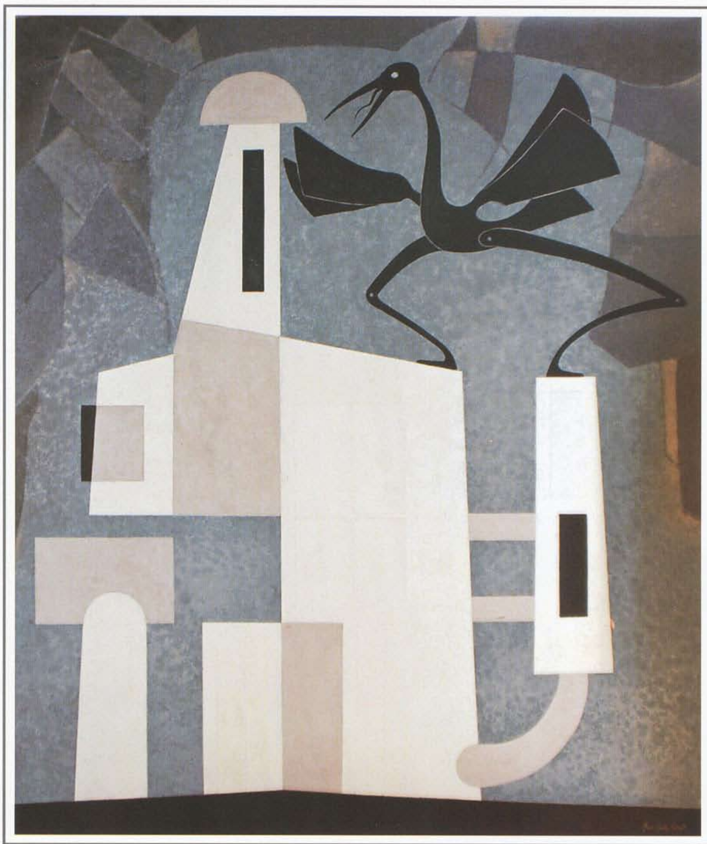
"Golondrina viajera" Óleo/Lino 140x120cm. 2007

LERDO DE TEJADA #2418 COL. LAFFAYETTE C.P. 44140 GUADALAJARA, JALISCO, MÉXICO. TELS: 52 (33) 3616-0078 / 3616-0079 www.verticegaleria.com info@verticegaleria.com