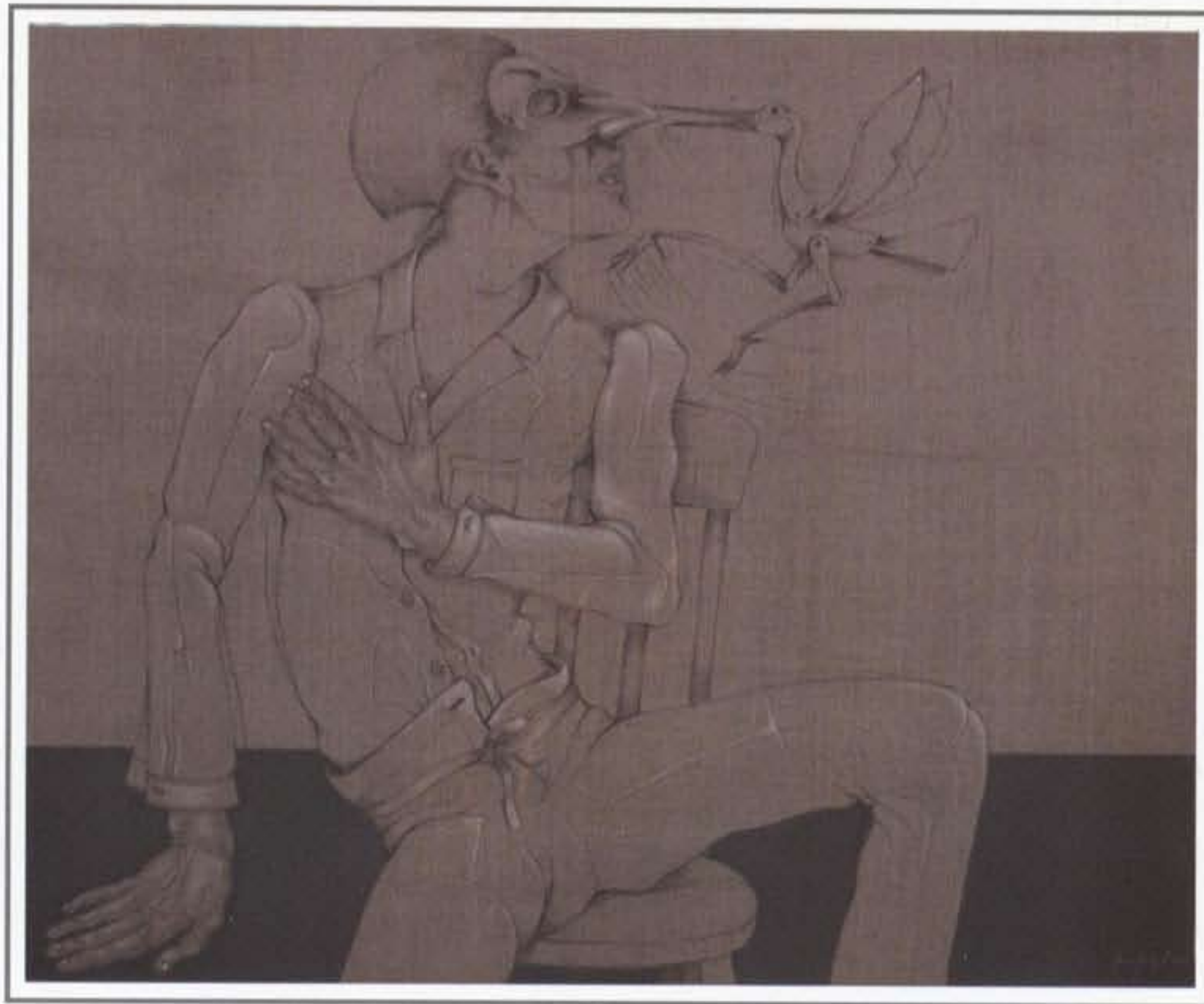
“Quien canta mejor” Mixta/Lino crudo 100x120cm. 2009

JUEVES 15 DE OCTUBRE DE 2009 A LAS 20:30 HRS.