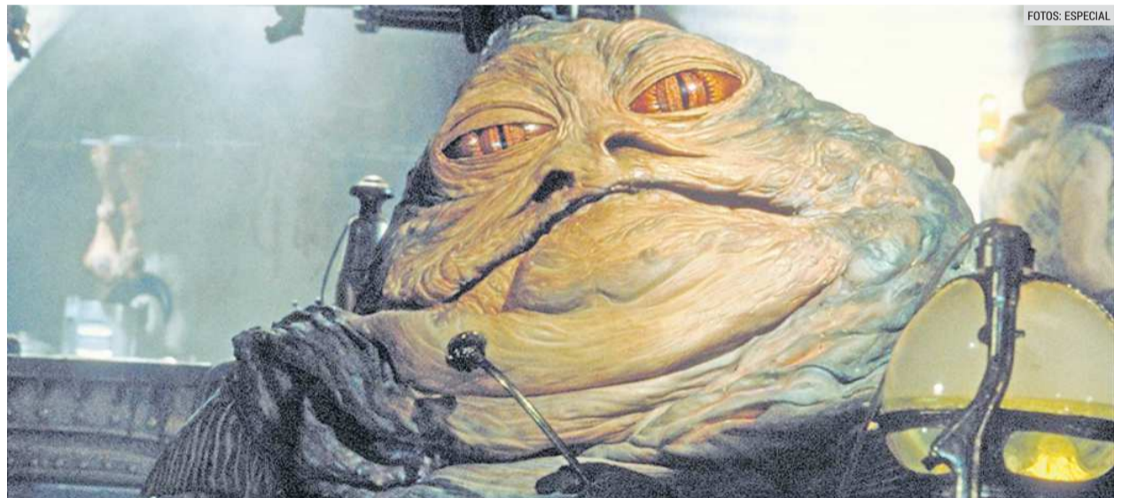
"EPISODIO VI. El Retorno de Jedi". La cinta será proyectada en una función al aire libre, frente al Edificio Arzoniz.