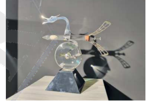
JERINGA ANTIGUA. Esta pieza simula ser una vacuna del COVID-19.