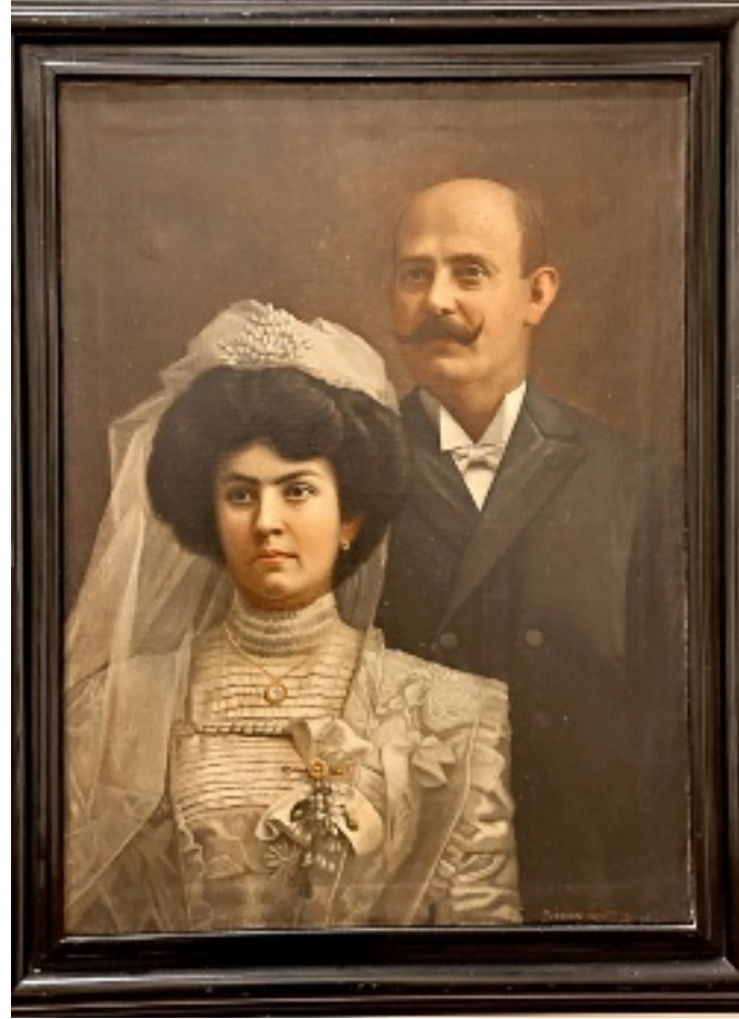
■ Obra de Francisco Sánchez Guerrero, fotógrafo y pintor, en la exposición “Las Maneras del Retrato”.