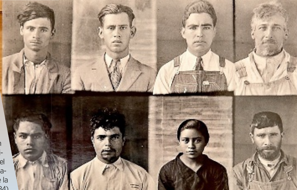
■ Tan relevante en la muestra es la pintura como la fotografía.

“El retrato es un ejercicio para saber cómo nos ven los otros, pero también cómo queremos que