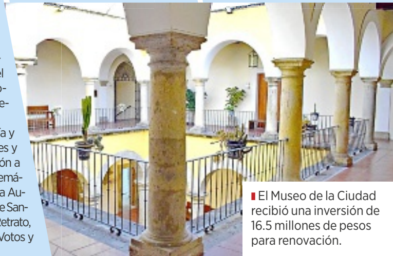
■ El Museo de la Ciudad recibió una inversión de 16.5 millones de pesos para renovación.