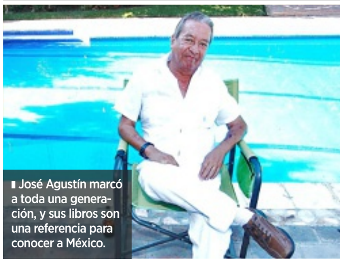
■ José Agustín marcó a toda una generación, y sus libros son una referencia para conocer a México.