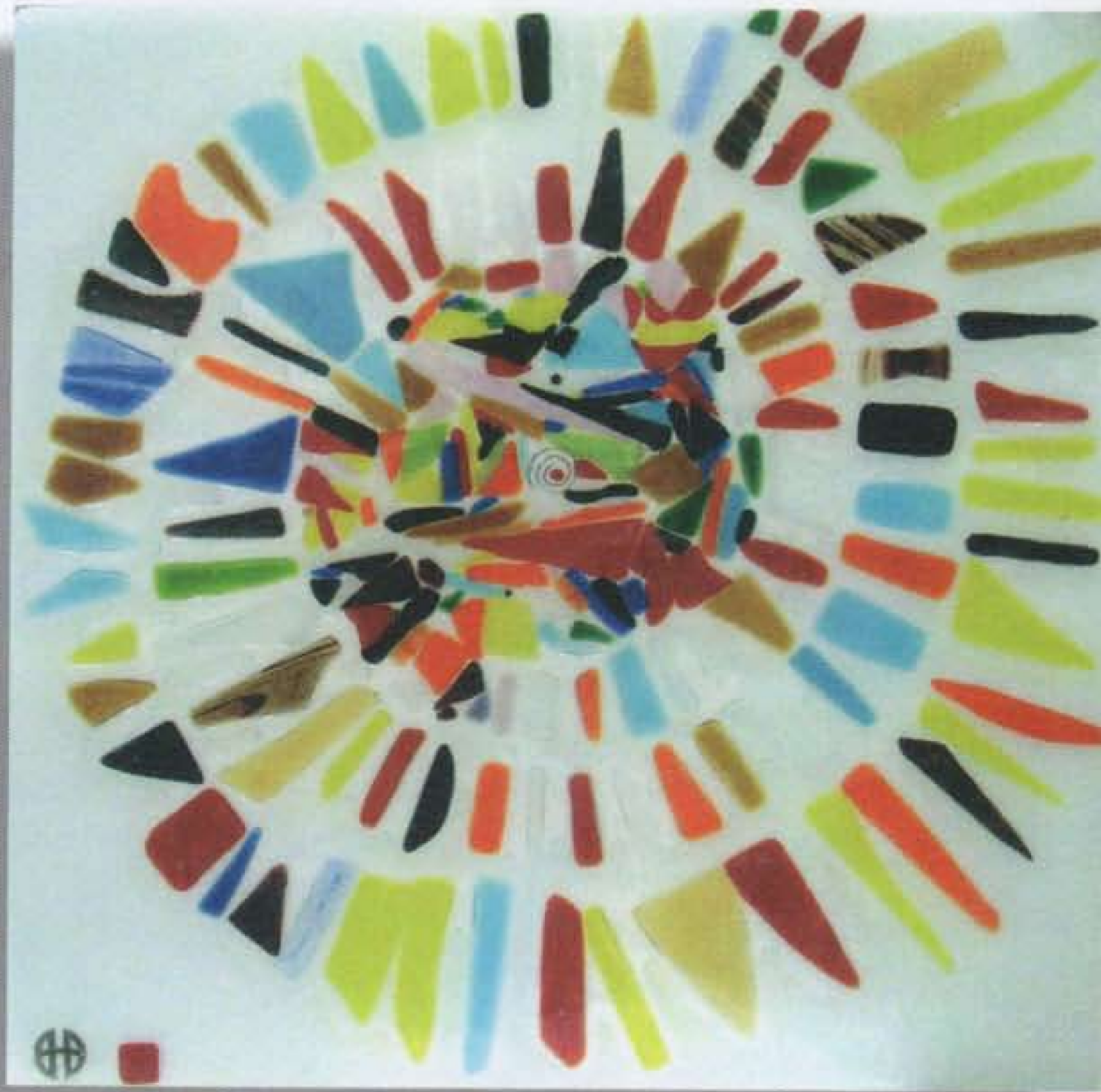
Título: En el espiral / técnica: vidrio fusionado / 2009 / autor: H. Barajas