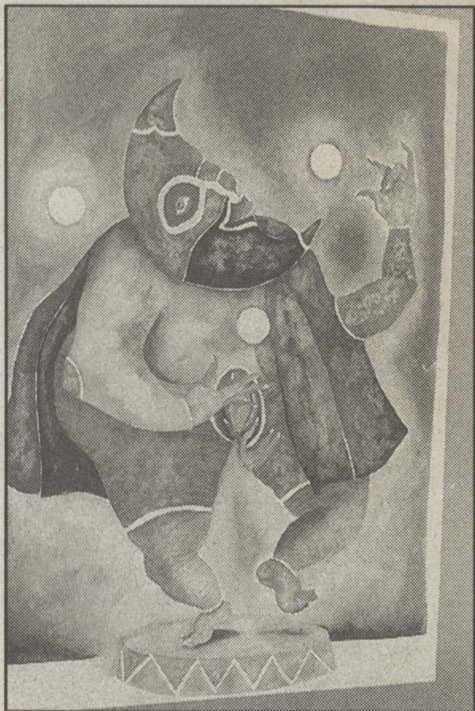
«Danza de la fertilidad».