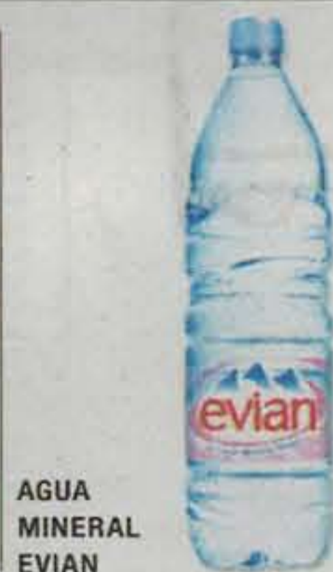
AGUA MINERAL EVIAN