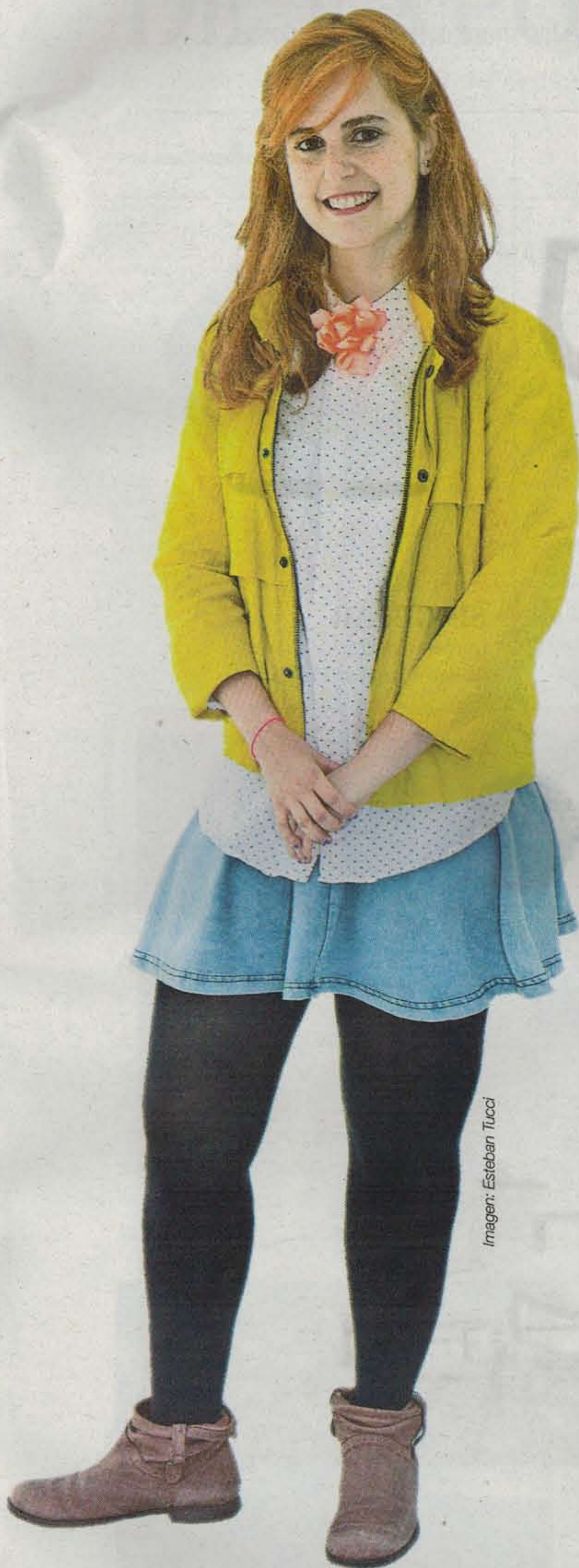
Imagen: Esteban Tucci