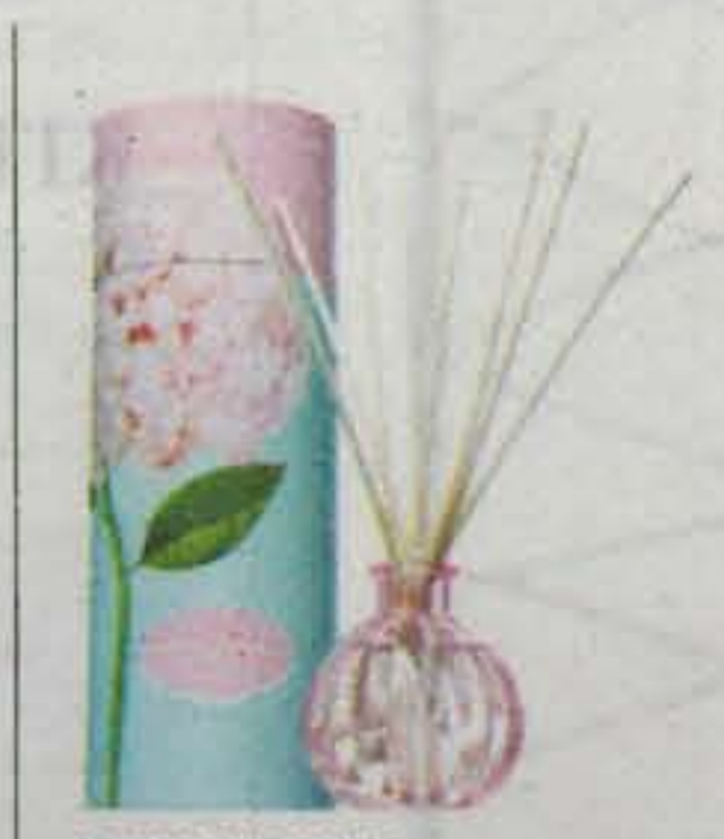
AROMATIZANTE, CHERRY BLOSSOM