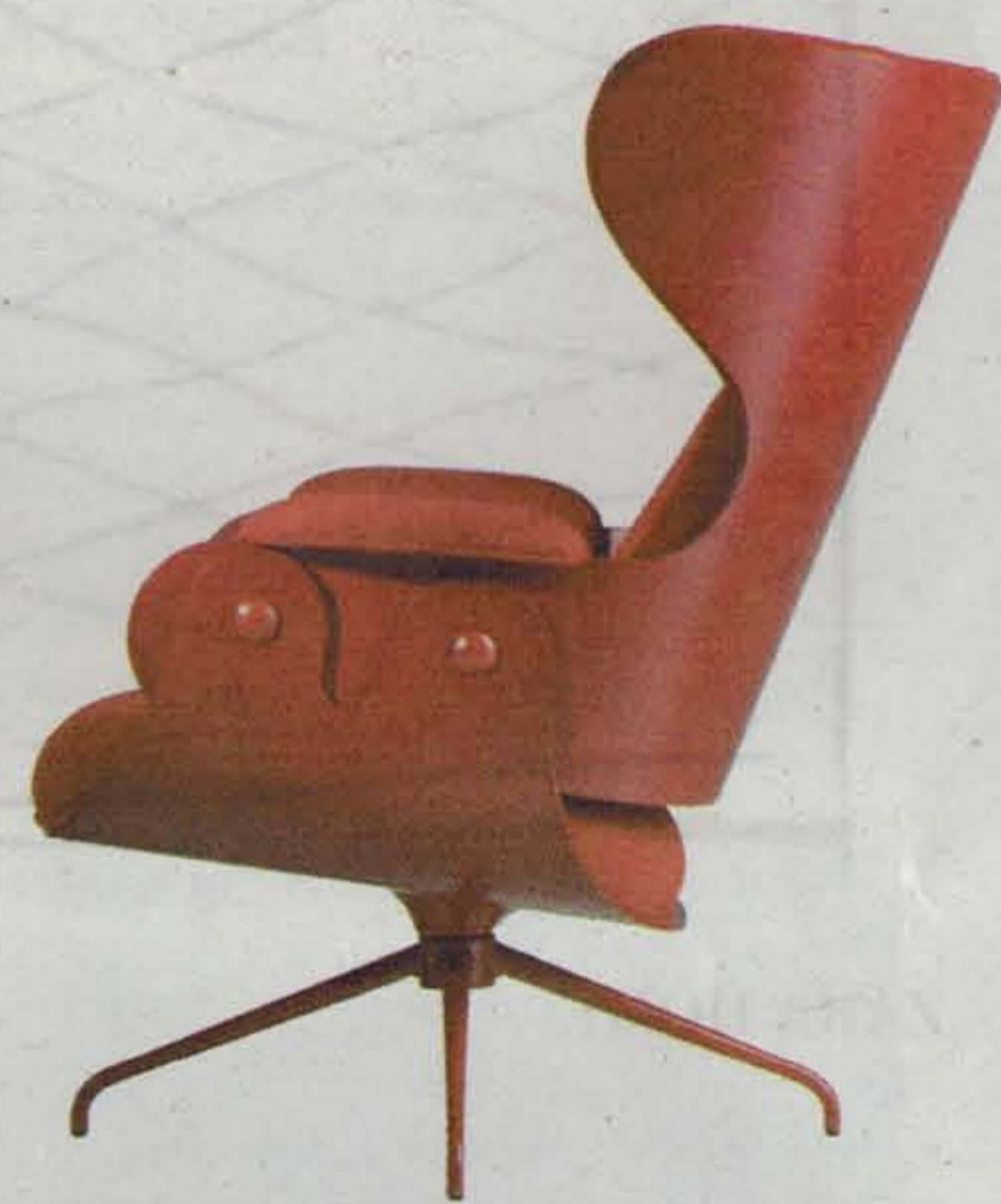
LOUNGER-BY JAIME HAYON