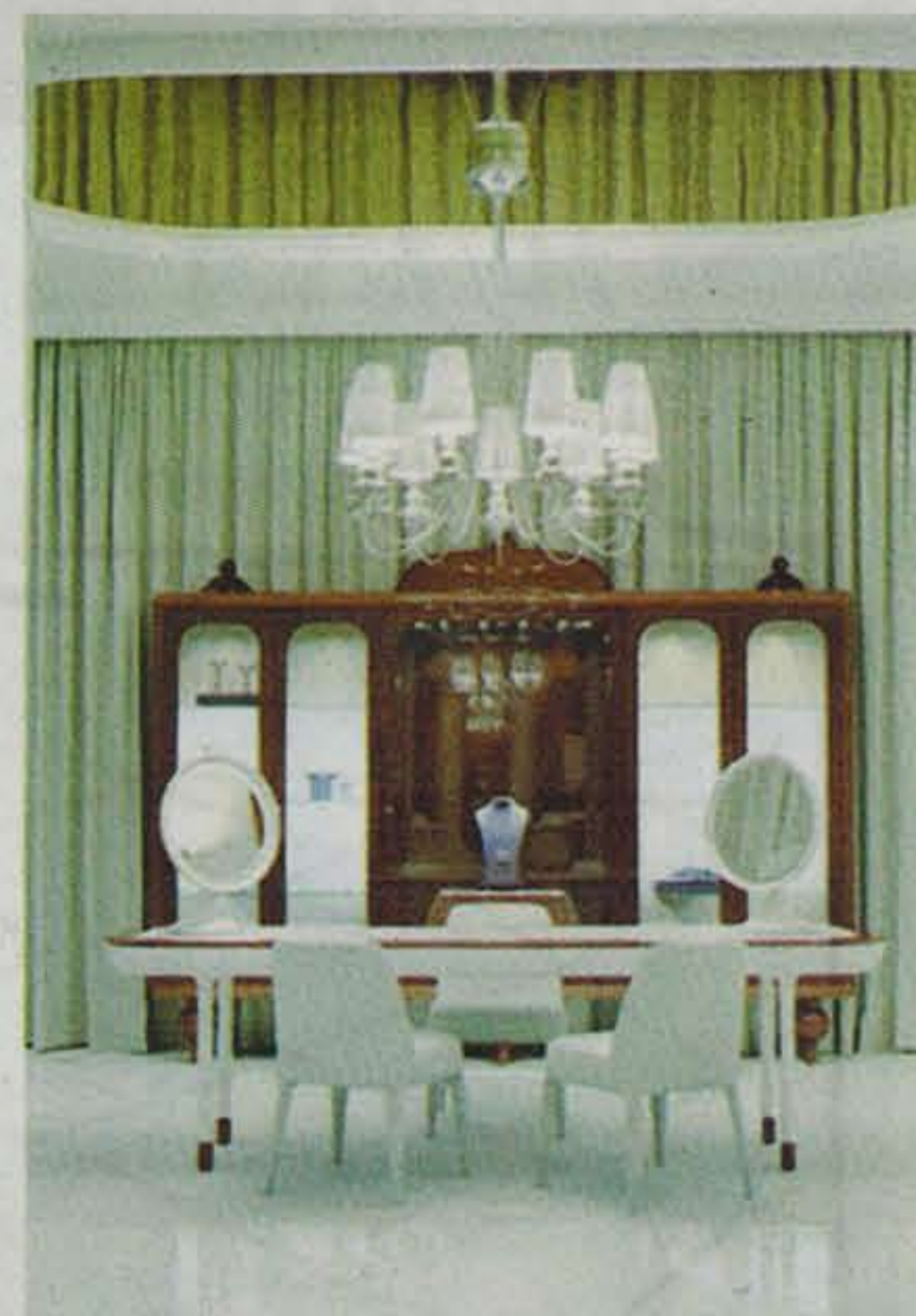
NEW FABERGE SALON GENEVA

El diseñador que más admira es Jaime Hayón. Si de leer se trata, el libro que más le gusta es El Orden Alfabético, de Juan José Millás. Su ciudad favorita es Londres, donde le gusta hospedarse en The Hoxton Hotel, el cual recomienda ampliamente. Su museo de artes favorito es el Museo de Orsay de París y su comida predilecta es el pozole mexicano